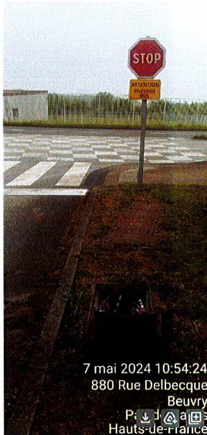
7 mai 2024 10:54:24 880 Rue Delbecque Beuvry Pas-de-Calais Hauts-de-France