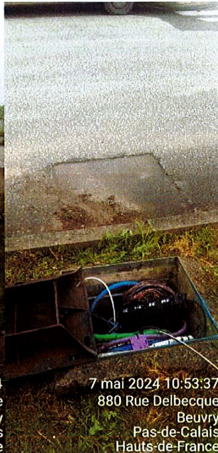
7 mai 2024 10:53:37 880 Rue Delbecque Beuvry Pas-de-Calais Hauts-de-France