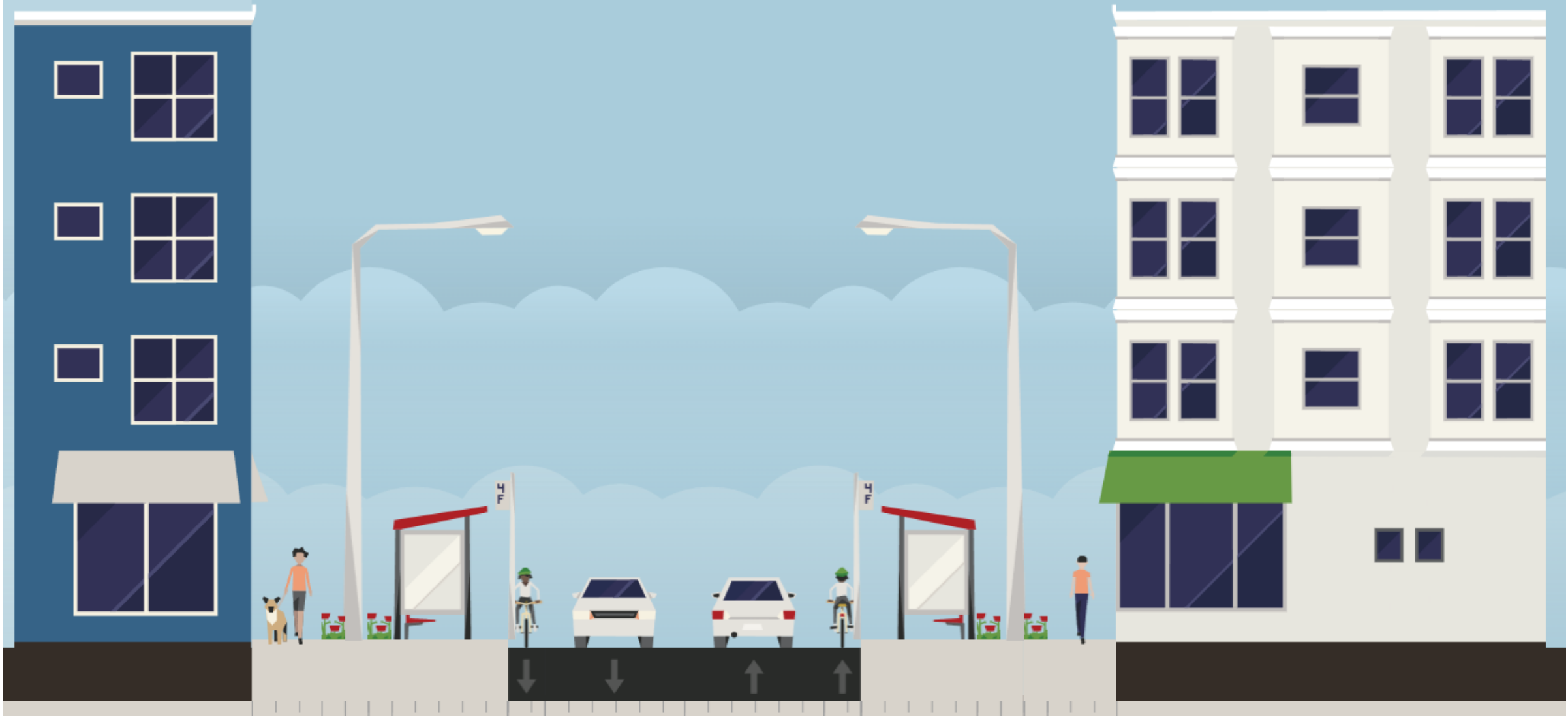
Schéma de principe de coupe en travers du projet :