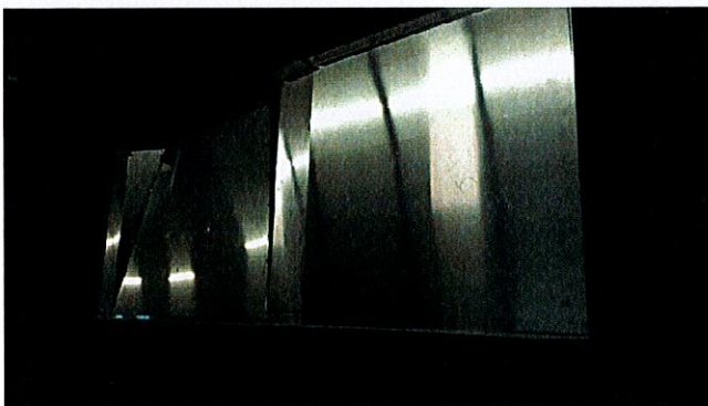
1 er module : 3 parties en aluminium