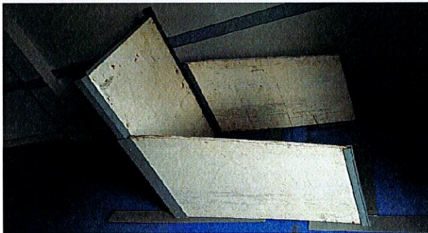
3 ème module : porte en bois sur en aluminium