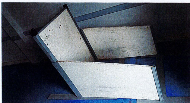
3 ème module : porte en bois sur en aluminium