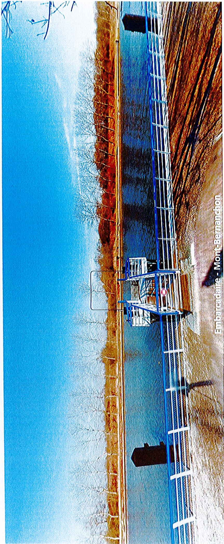
Embarcadere - Mont-Bernancho