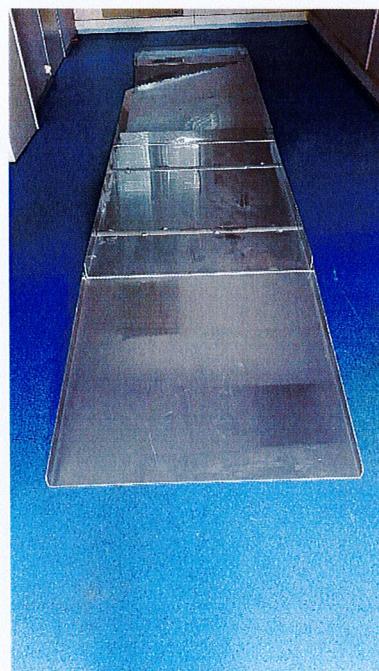
2 ème module : 4 parties en aluminium