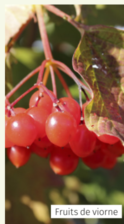
Fruits de viorne