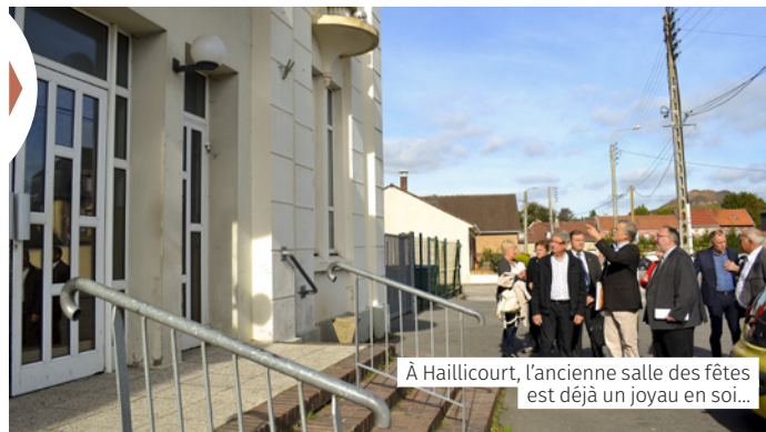
À Haillicourt, l'ancienne salle des fêtes est déjà un joyau en soi...

K iosque, salle des fêtes, cinéma, deux écoles, la commune de Haillicourt possède des éléments d'architecture Art déco dont elle est très fière. La salle des fêtes (salle multi-activités maintenant), qui fait partie d'un circuit de visites proposé par l'office de tourisme, avait besoin d'être restaurée et mise aux normes (la dernière rénovation y a été menée au milieu des années 80). Le chantier sera important puisque le coût total des travaux est de l'ordre de 1,2 million d'euros hors taxes, la Communauté d'agglomération apportant son aide à hauteur de 245 000 €. Les travaux porteront sur la rénovation thermique du bâtiment mais aussi sur la réhabilitation complète de la façade et des espaces intérieurs, eux aussi d'origine (1935). Ils seront menés à partir du mois de janvier.