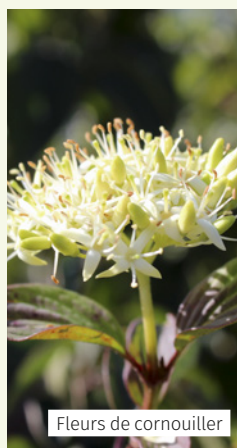
Fleurs de cornouiller

> 5 décembre - à partir de 19 h 30 à l'espace culturel et associatif de Vermelles (derrière la mairie, rue René-Cassin).