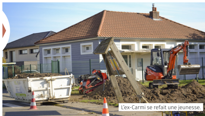
L'ex-Carmi se refait une jeunesse.

À la cité de Madagascar, c'est l'ancien dispensaire de la Carmi qui va être transformé pour accueillir un Point d'information jeunesse. Un chantier de 177 886 € financé par une subvention communautaire spécifique « Politique de la ville » de 70 000 €.