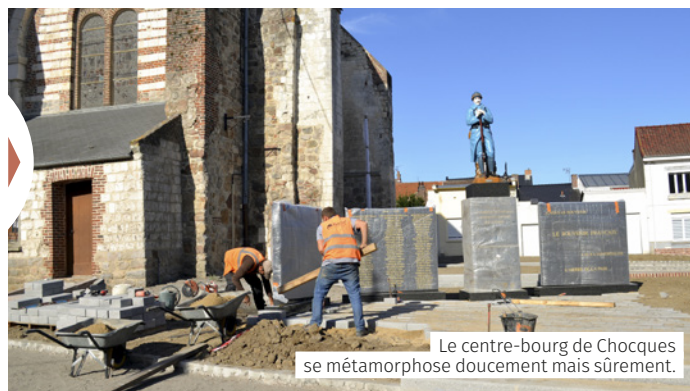
Le centre-bourg de Chocques se métamorphose doucement mais sûrement.

La commune de Chocques mène, depuis plusieurs années déjà, des travaux visant à réaménager totalement son centre-bourg. Après la rue principale et ses abords, maintenant du plus bel effet, c'est le secteur de l'église qui connaît une profonde métamorphose. Ces aménagements coûteront près de 700 000 € hors taxes, et seront financés pour 181 480 € par l'Agglomération.